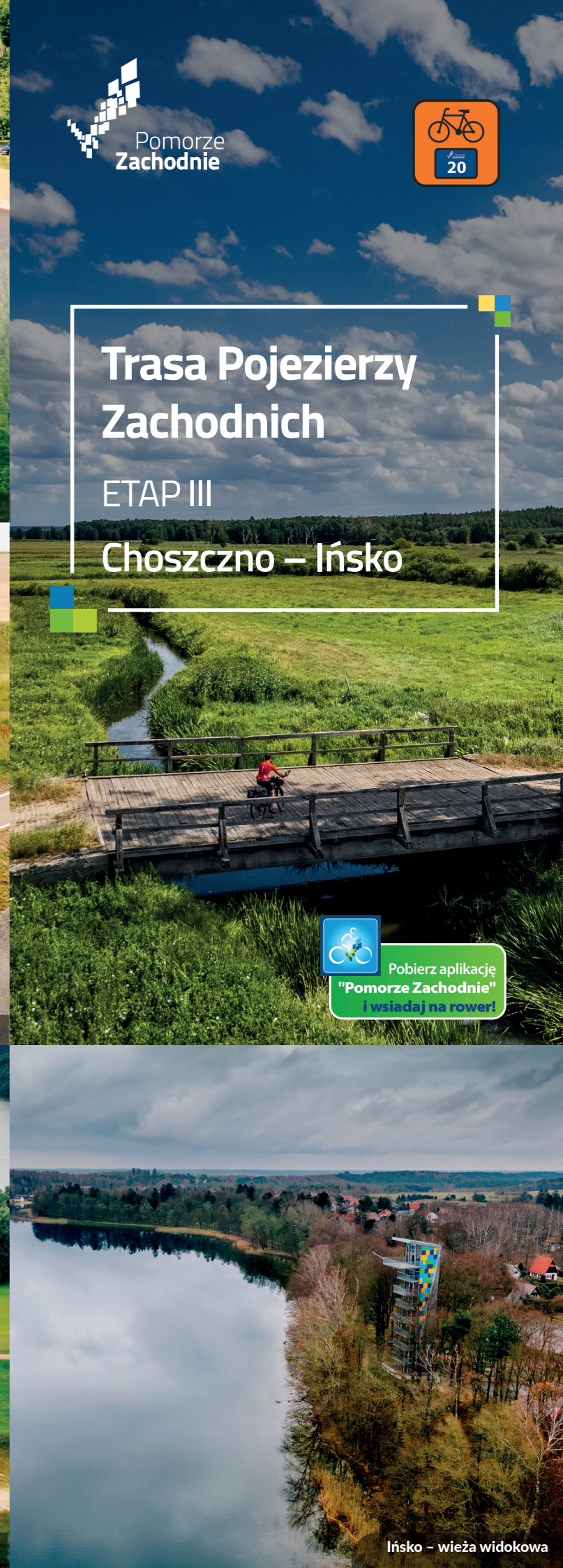
Ińsko – wieża widokowa