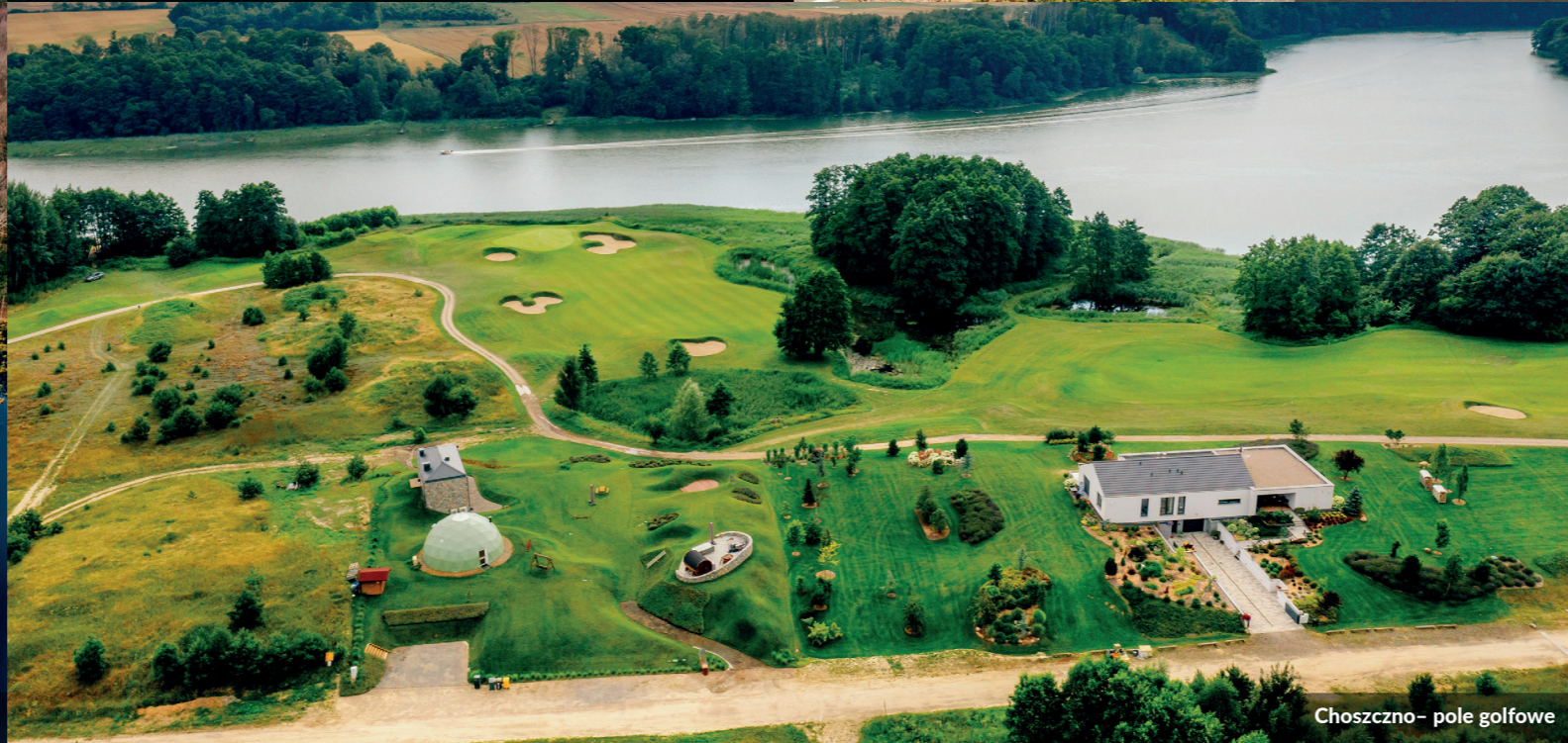
Choszczno – pole golfowe