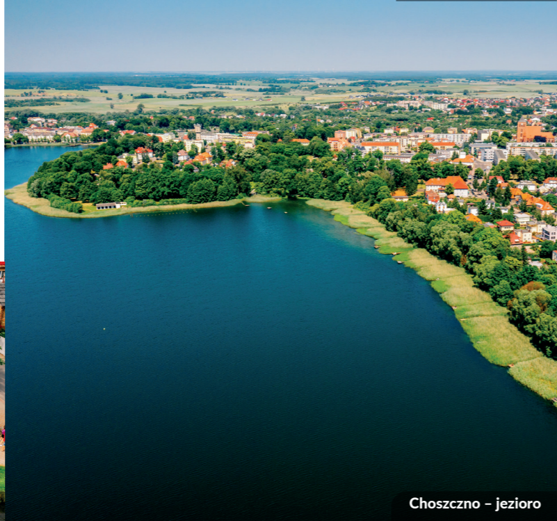
Choszczno – jezioro