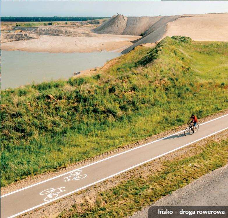
Ińsko – droga rowerowa