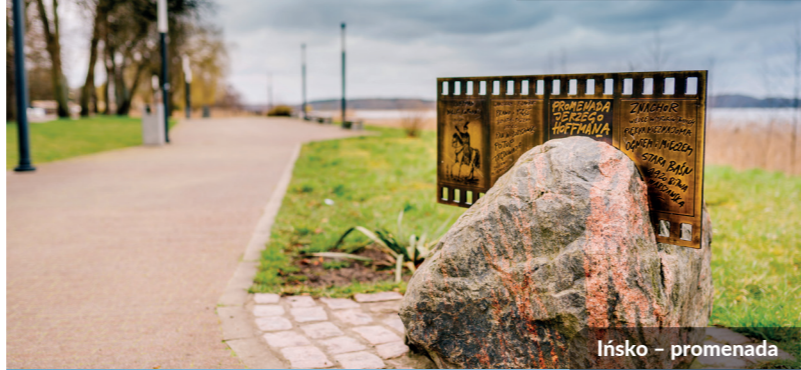
Ińsko – promenada