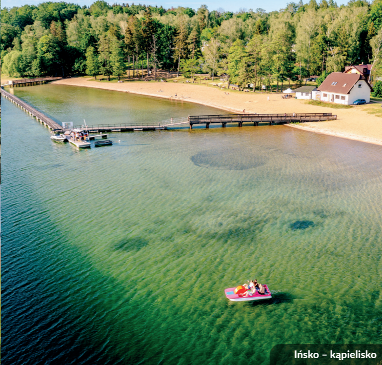
Ińsko – kąpielisko