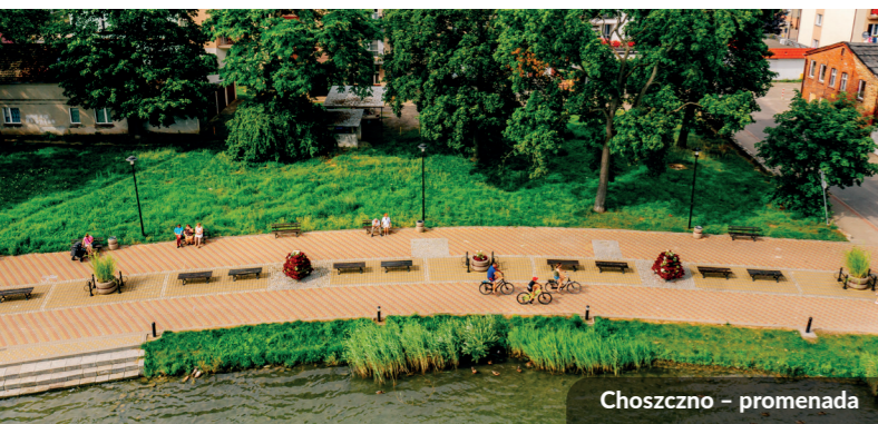
Choszczno – promenada