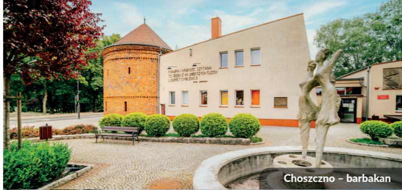
Choszczno – barbakan

Projekt dofinansowany przez Unię Europejską ze środków Europejskiego Funduszu Społecznego w ramach Regionalnego Programu Operacyjnego Województwa Zachodniopomorskiego 2014–2020.