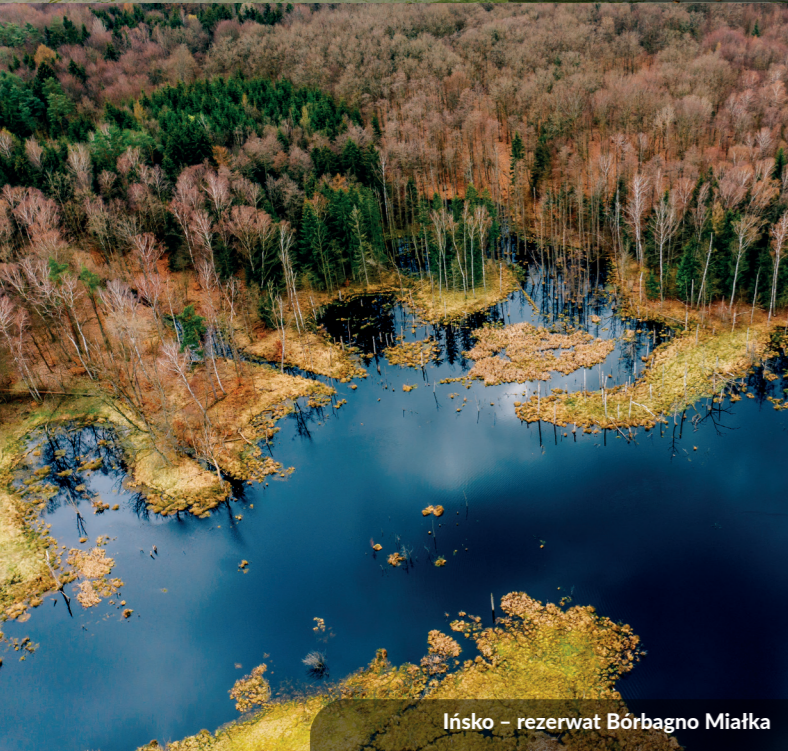
Ińsko – rezerwat Bórbagno Miałka