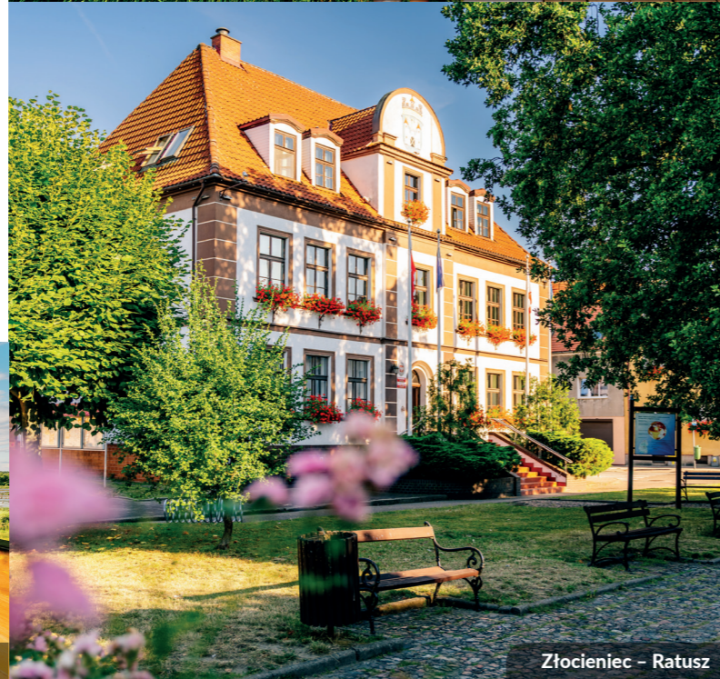
Złocieniec – Ratusz