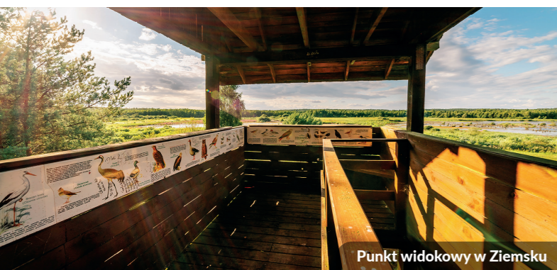
Punkt widokowy w Ziemsku

Pobierz aplikację "Pomorze Zachodnie" i wsiadaj na rower!