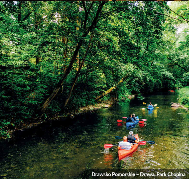
Drawsko Pomorskie – Drawa, Park Chopina