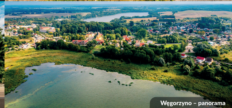
Węgorzyno – panorama