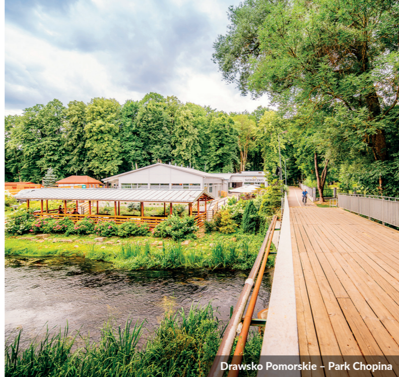
Drawsko Pomorskie – Park Chopina

Projekt dofinansowany przez Unię Europejską ze środków Europejskiego Funduszu Społecznego w ramach Regionalnego Programu Operacyjnego Województwa Zachodniopomorskiego 2014–2020.