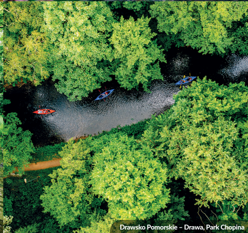
Drawsko Pomorskie – Drawa, Park Chopina