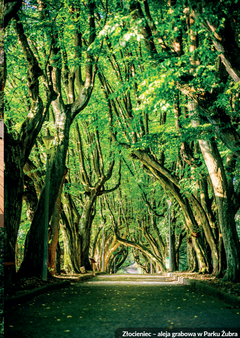
Złocieniec – aleja grabowa w Parku Żubra