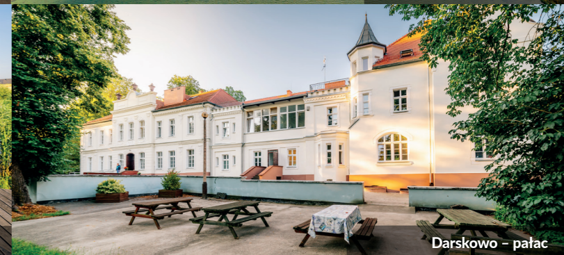
Daraskowo – pałac