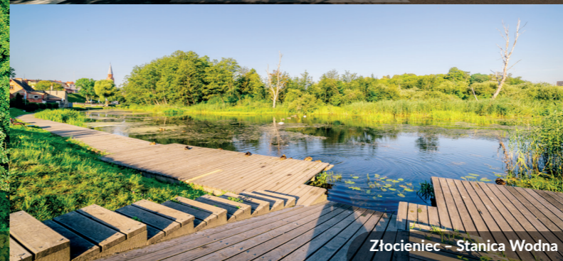
Złocieniec – Stacja Wodna