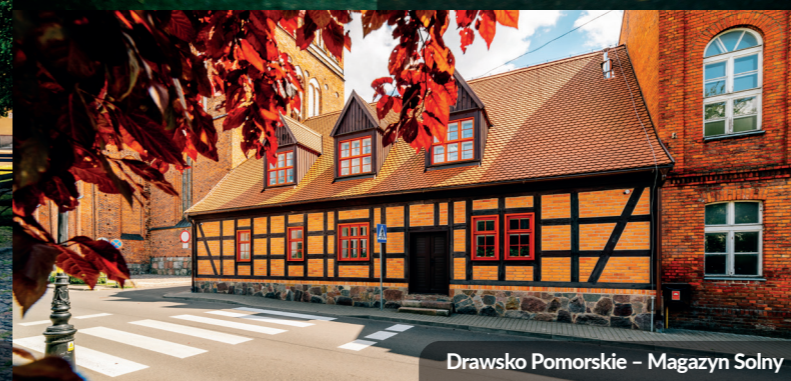
Drawsko Pomorskie – Magazyn Solny