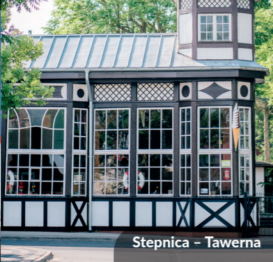
Stepnica – Tawerna