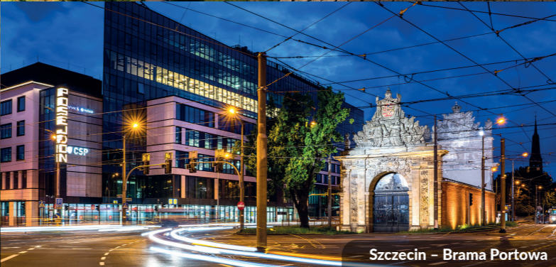
Szczecin – Brama Portowa