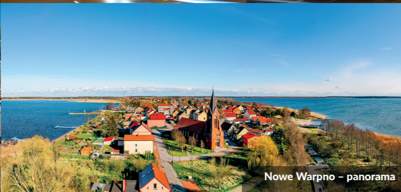
Nowe Warpno – panorama