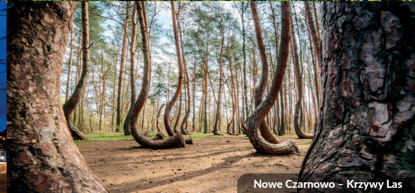
Nowe Czarnowo – Krzywy Las