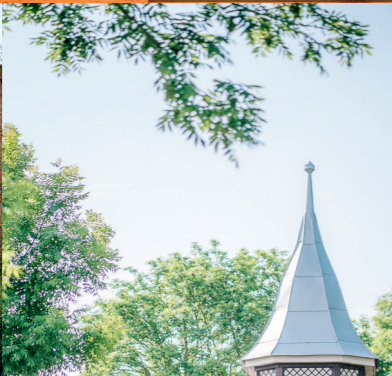
Stepnica – Tawerna