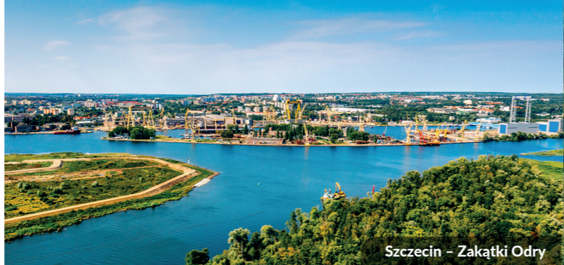
Szczecin – Zakątki Odry

Projekt dofinansowany przez Unię Europejską ze środków Europejskiego Funduszu Społecznego w ramach Regionalnego Programu Operacyjnego Województwa Zachodniopomorskiego 2014–2020.