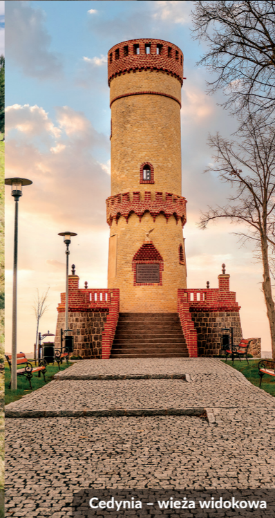
Cedynia – wieża widokowa