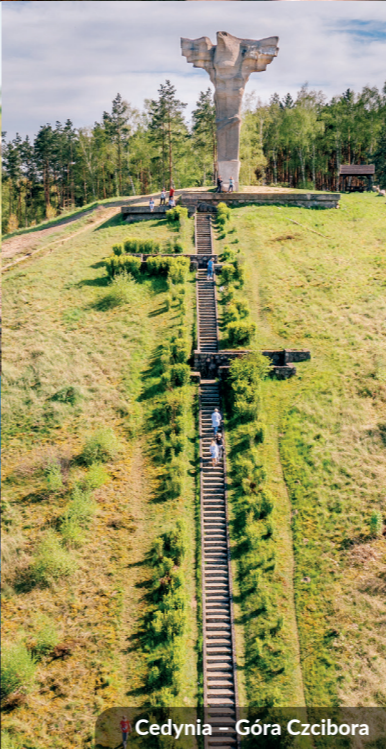
Cedynia – Góra Czciwora