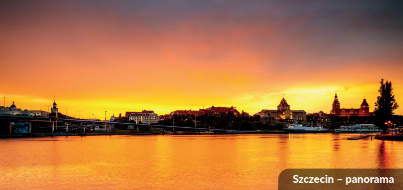
Szczecin – panorama