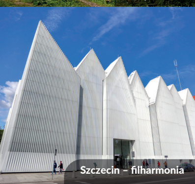
Szczecin – filharmonia