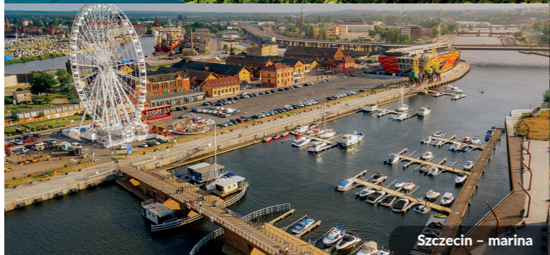
Szczecin – marina