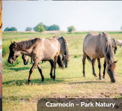
Czarnocin – Park Natury