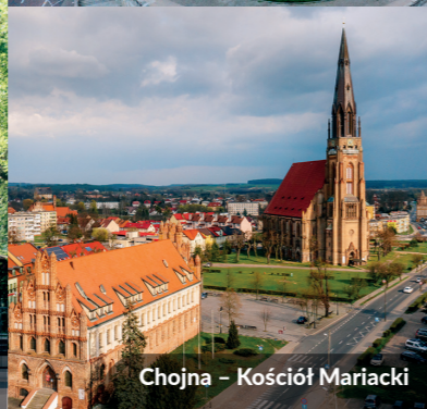
Chojna – Kościół Mariacki