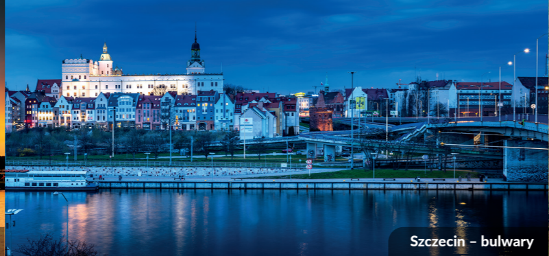
Szczecin – bulwary