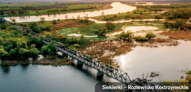
Siekierki – Rozlewisko Kostrzyneckie