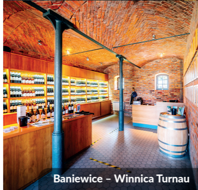
Baniewice – Winnica Turnau