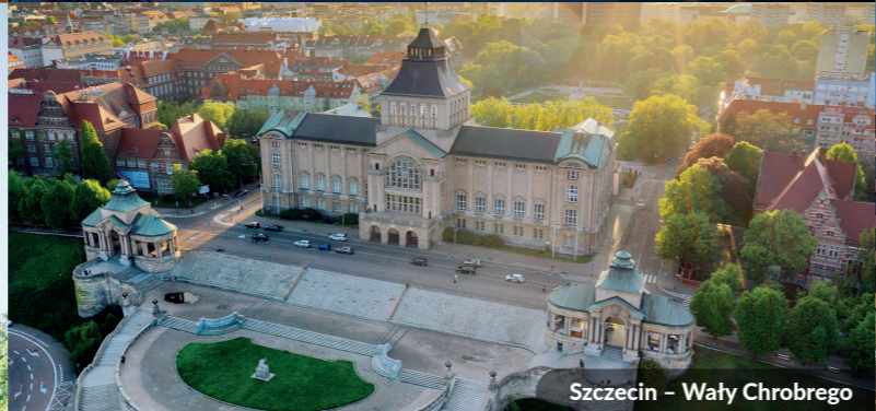
Szczecin – Wały Chrobrego