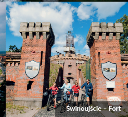
Świnoujście – Fort