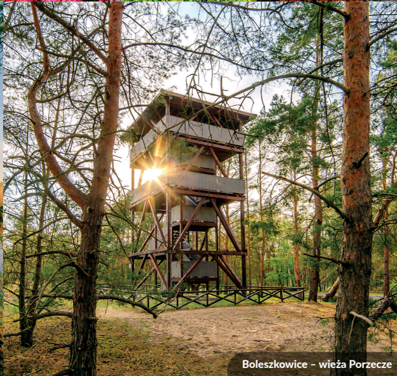
Boleszkowice – wieża Porzece