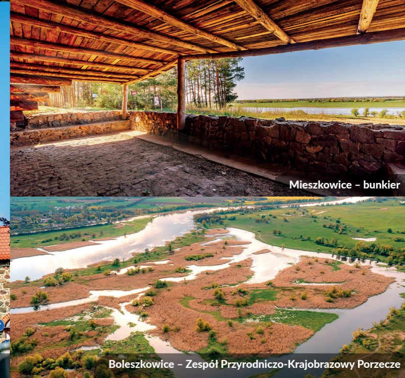
Boleszkowice – Zespół Przyrodniczo-Krajobrazowy Porzece