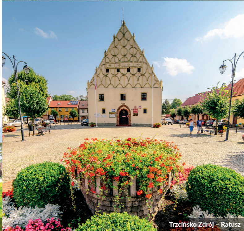
Trzcińsko Zdrój – Ratusz