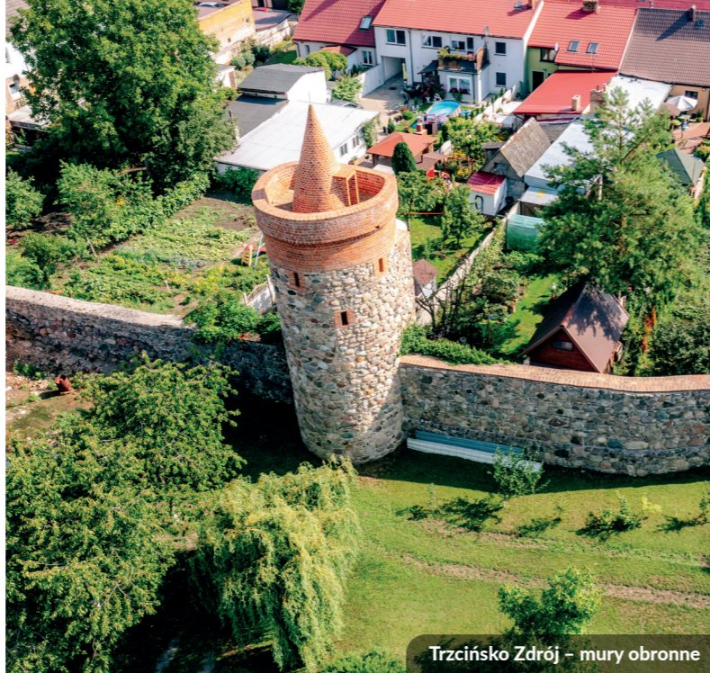
Trzcińsko Zdrój – mury obronne

Projekt dofinansowany przez Unię Europejską ze środków Europejskiego Funduszu Społecznego w ramach Regionalnego Programu Operacyjnego Województwa Zachodniopomorskiego 2014–2020.