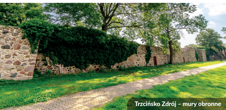
Trzcińsko Zdrój – mury obronne

Pobierz aplikację "Pomorze Zachodnie" i wsiadaj na rower!