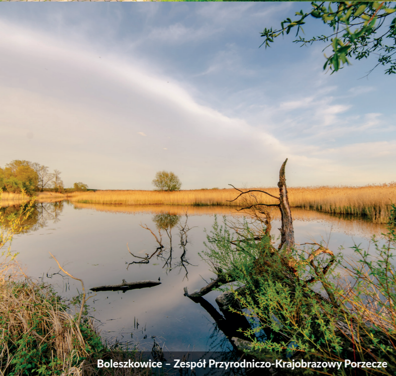
Boleszkowice – Zespół Przyrodniczo-Krajobrazowy Porzece