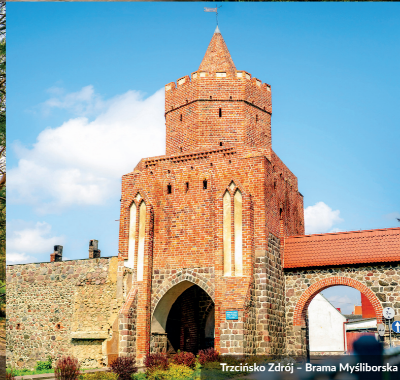
Trzcińsko Zdrój – Brama Myśluborska