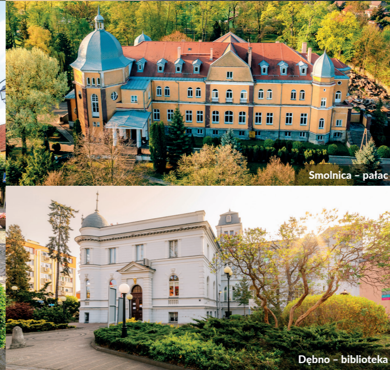
Smolnica – pałac