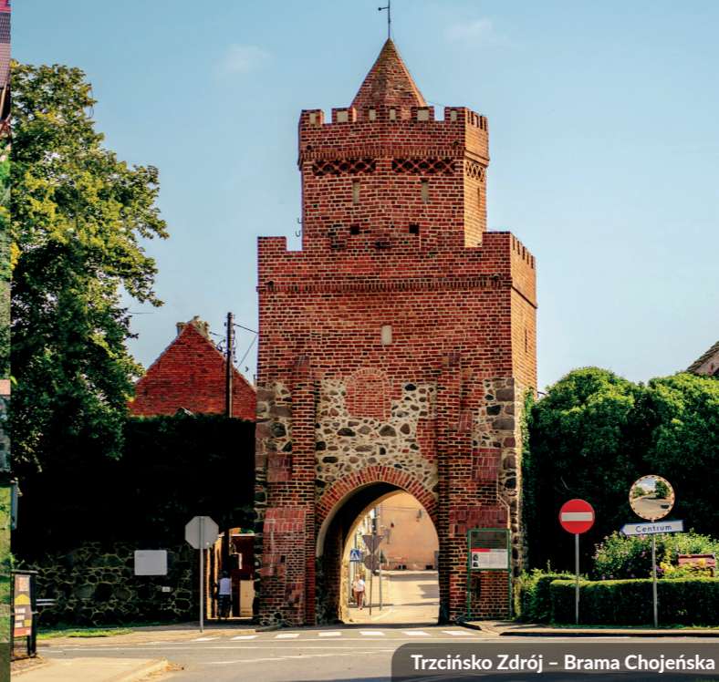
Trzcińsko Zdrój – Brama Chojeńska