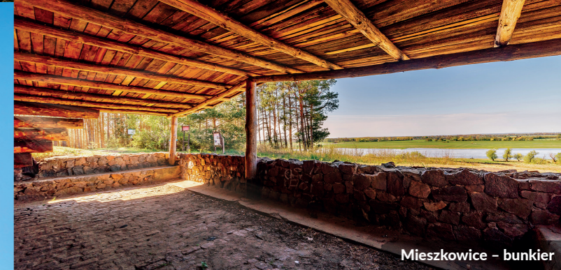
Mieszkowice – bunkier