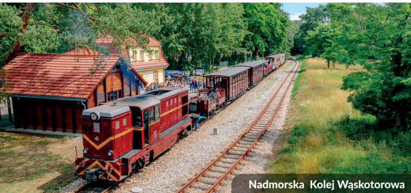
Nadmorska Kolej Wąskotorowa