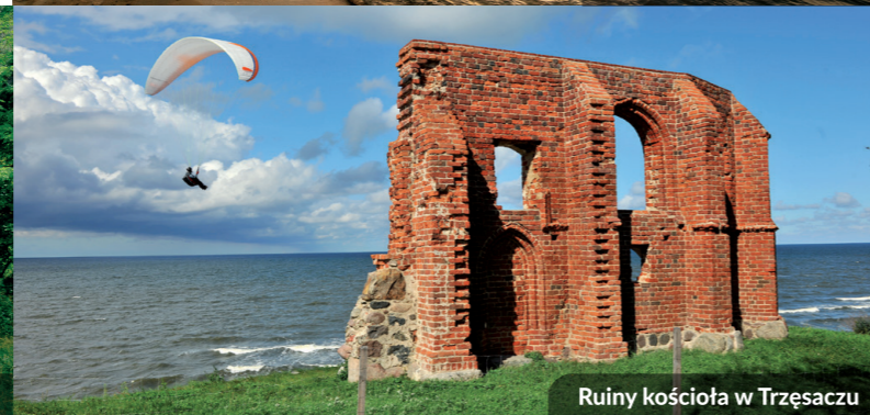
Ruiny kościoła w Trzęszacu