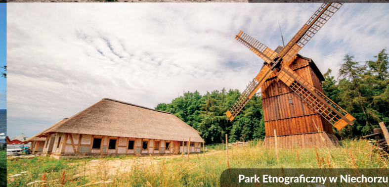
Park Etnograficzny w Niechorzu