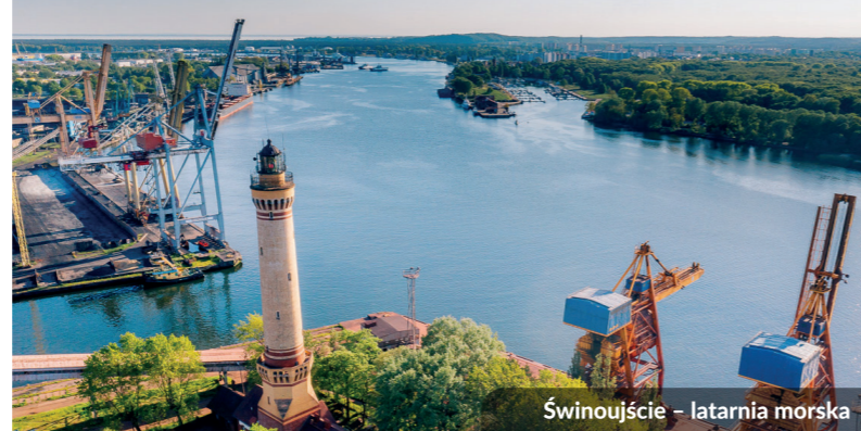
Świnoujście - latarnia morska