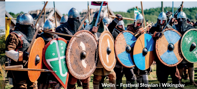
Wolin - Festiwal Słowian i Wikingów