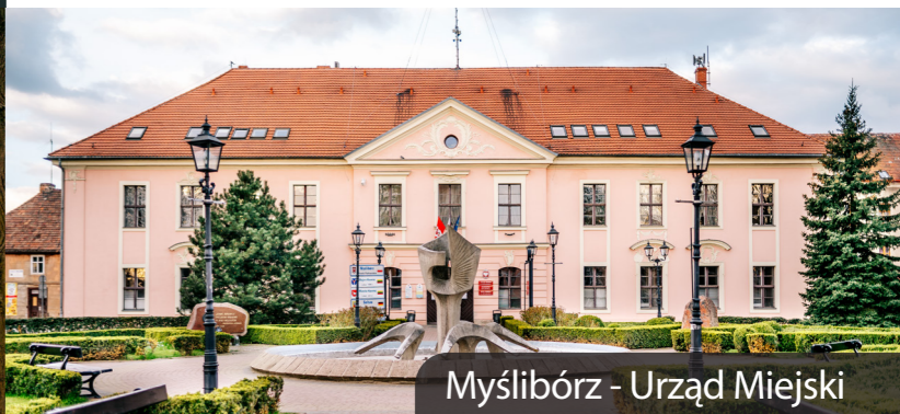
Myślibórz - Urząd Miejski