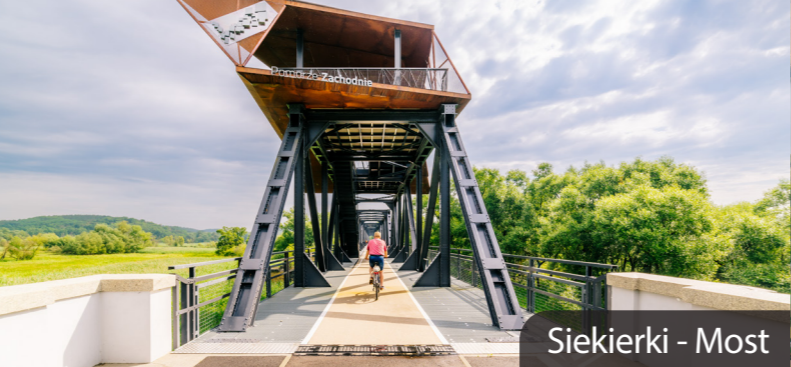
Siekierki - Most