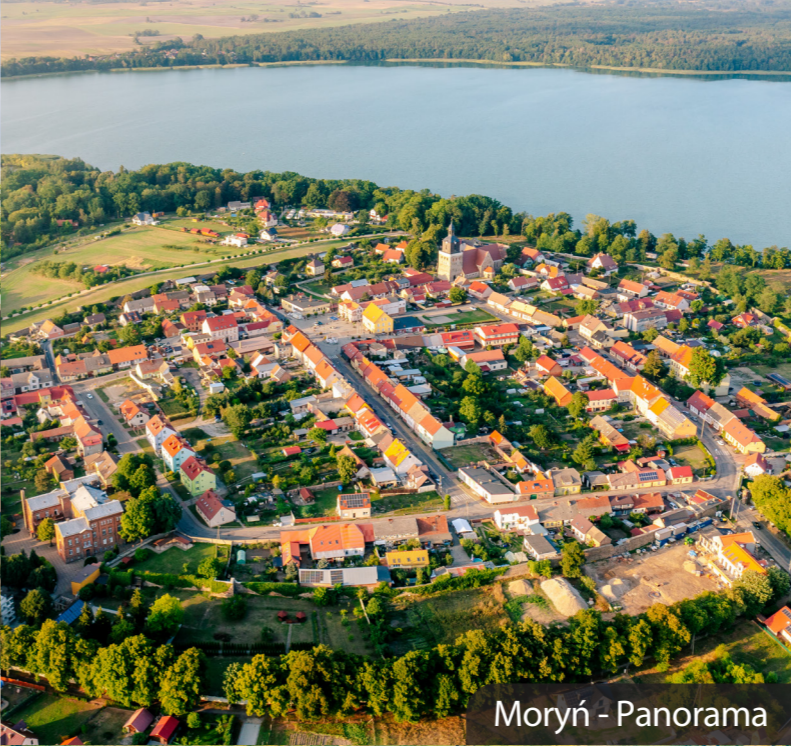
Moryń - Panorama