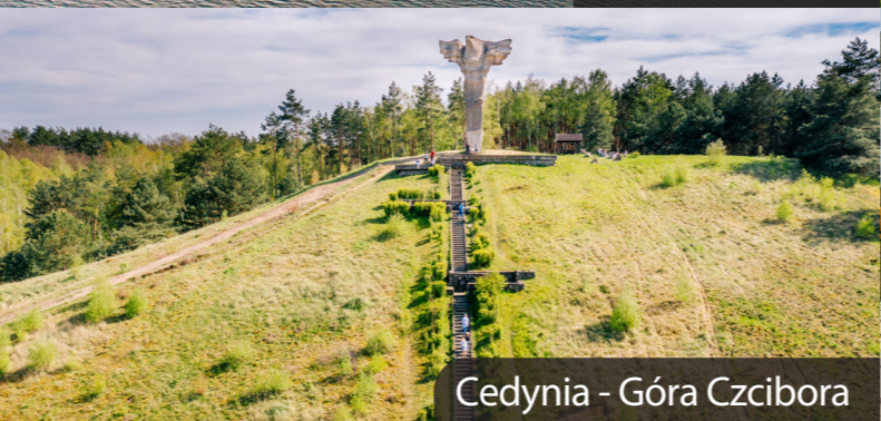
Cedynia - Góra Czcibora