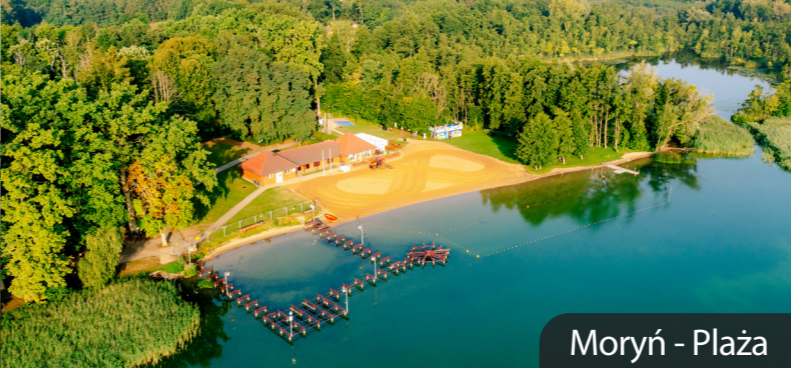
Moryń - Plaża