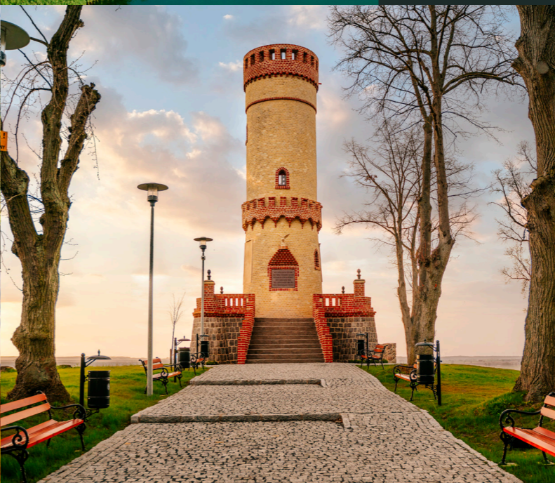
Cedynia - Wieża widokowa