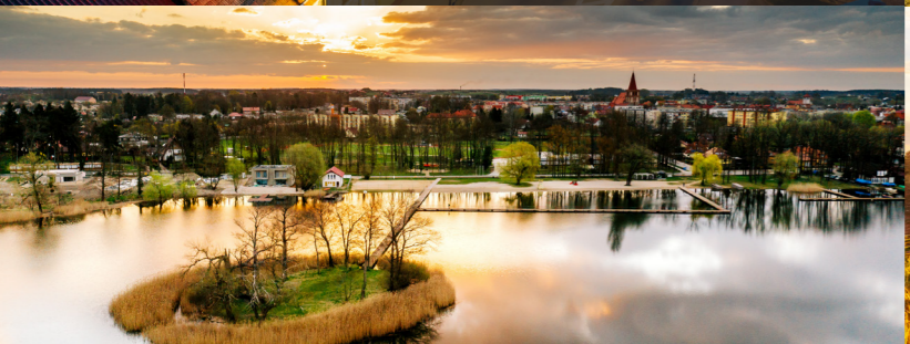
Myślibórz - Jezioro Myśliborskie