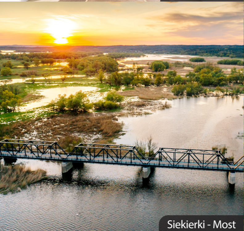
Siekierki - Most