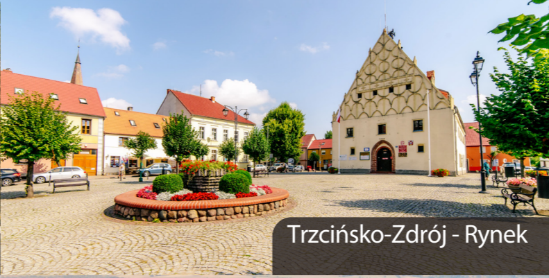
Trzcińsko-Zdrój - Rynek