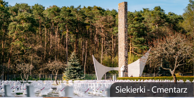
Siekierki - Cmentarz