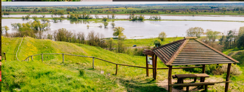
Stary Kostrzynek - Punkt widokowy