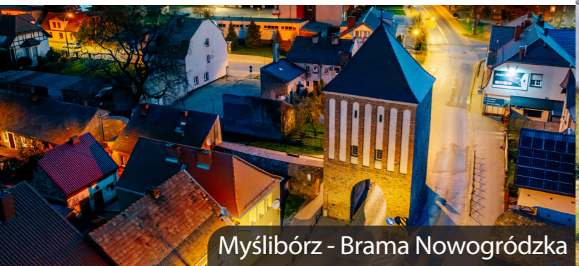
Myślibórz - Brama Nowogródzka