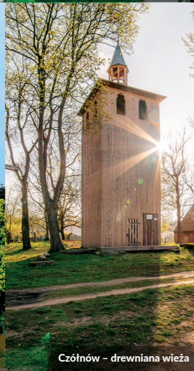
Czółnow – drewniana wieża