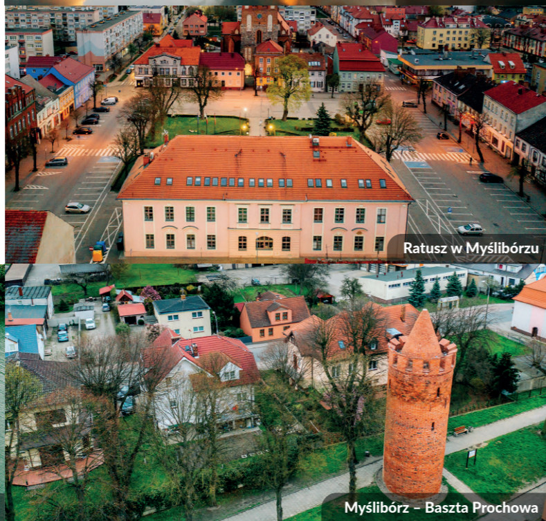
Ratusz w Myślibórz