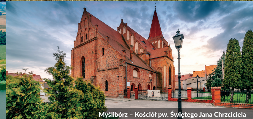
Myślibórz – Kościół pw. Świętego Jana Chrzciciela