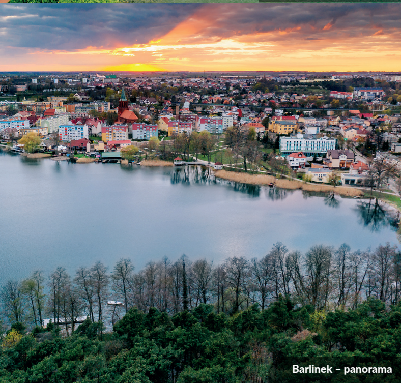
Barlinek – panorama

Pobierz aplikację "Pomorze Zachodnie" i wsiađaj na rower!