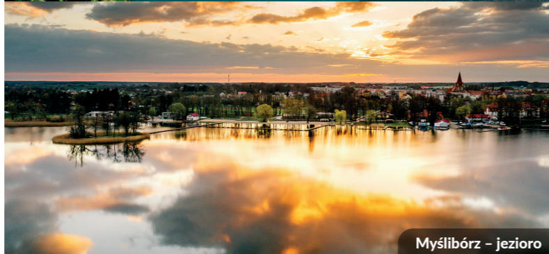
Myślibórz – jezioro