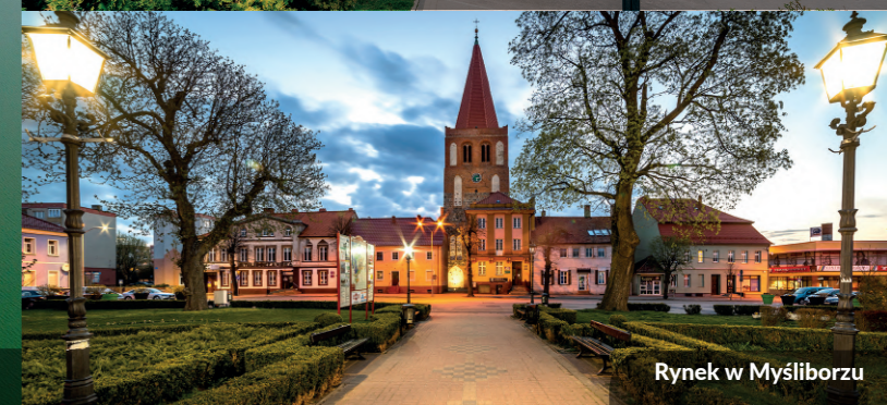
Rynek w Myślibórz