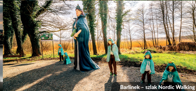
Barlinek – szlak Nordic Walking