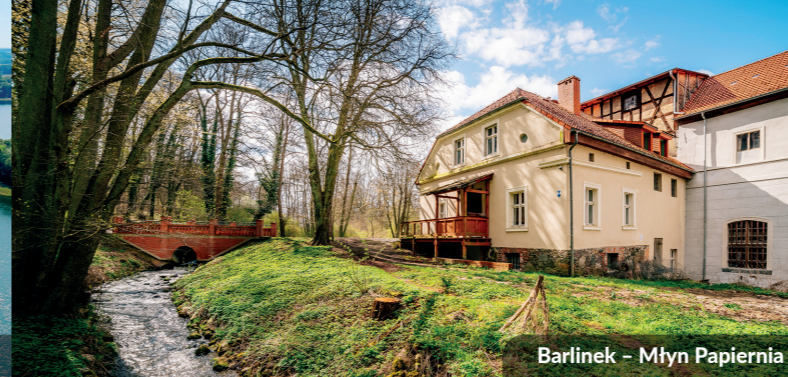
Barlinek – Młyn Papiernia