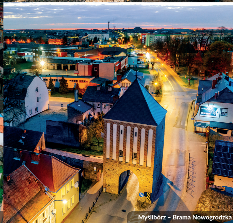
Myślibórz – Brama Nowogrodzka