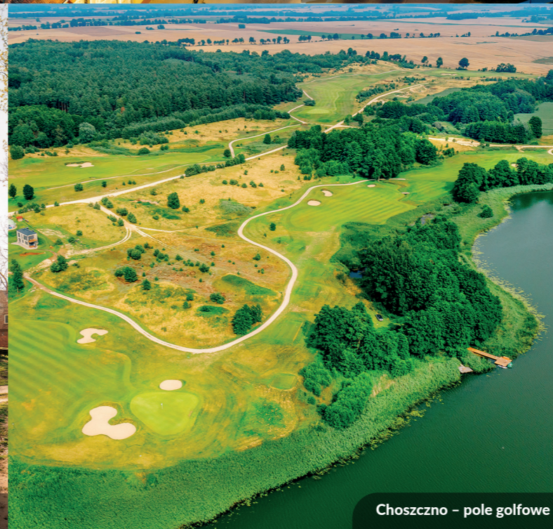
Choszczno – pole golfowe