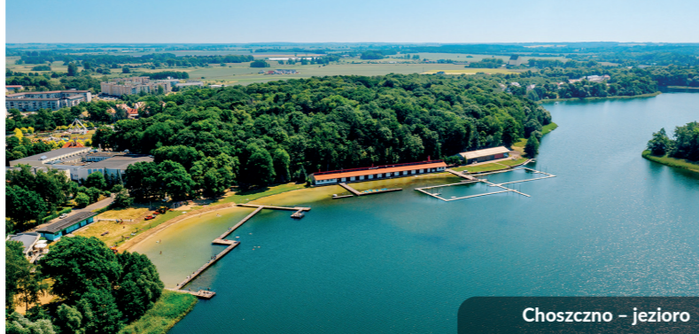
Choszczno – jezioro

Projekt dofinansowany przez Unię Europejską ze środków Europejskiego Funduszu Społecznego w ramach Regionalnego Programu Operacyjnego Województwa Zachodniopomorskiego 2014–2020.