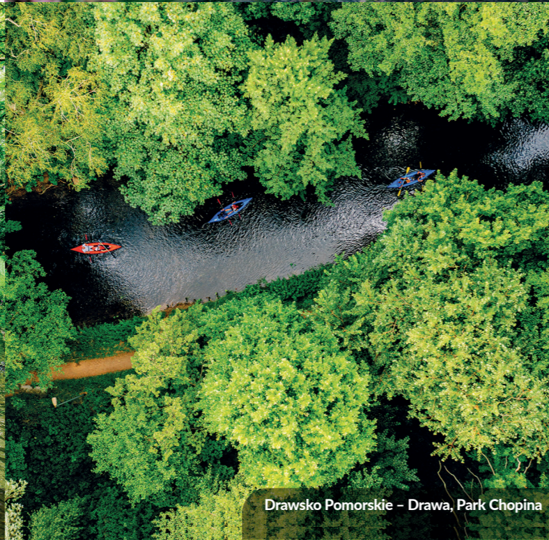
Drawsko Pomorskie - Drawa, Park Chopina