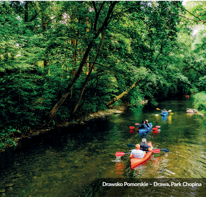
Drawsko Pomorskie - Drawa, Park Chopina