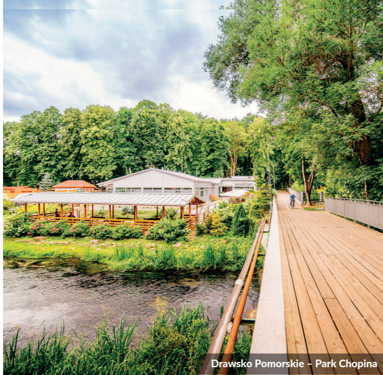
Drawsko Pomorskie - Park Chopina

Budowę tras rowerowych dofinansowano z Funduszy Europejskich