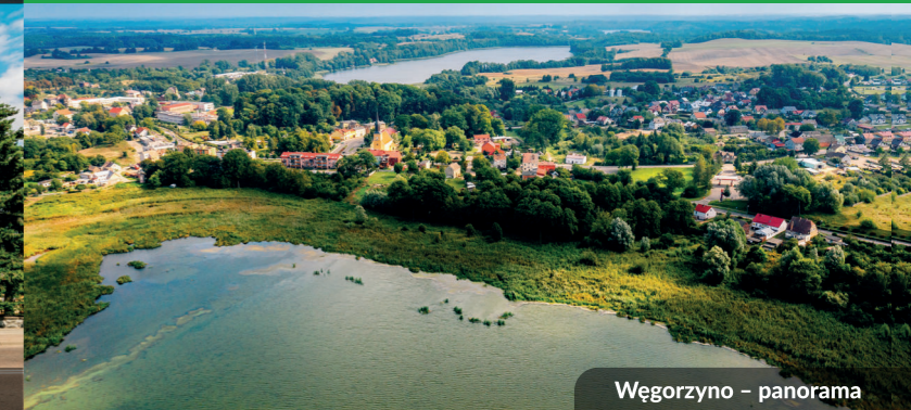
Węgorzyno - panorama