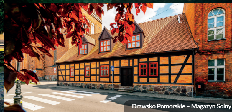
Drawsko Pomorskie - Magazyn Solny