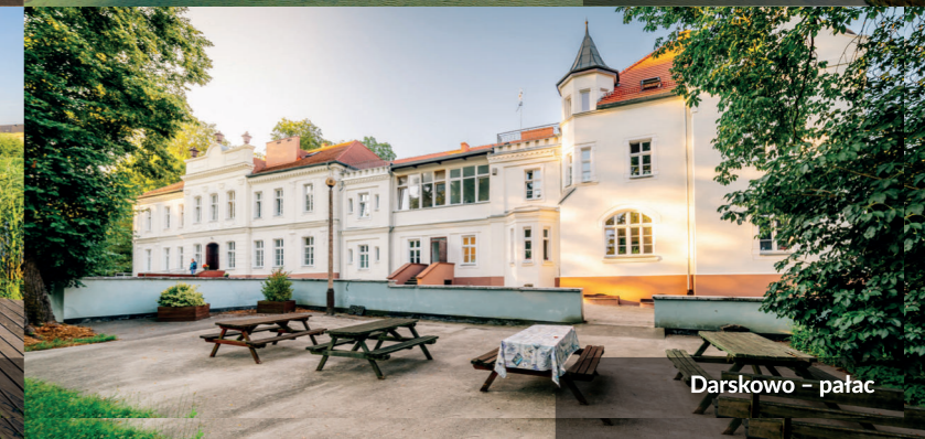
Darskowo - pałac