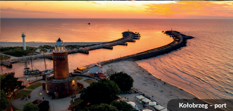
Kołobrzeg – port