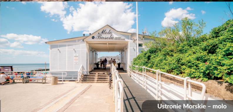
Ustronie Morskie – moło