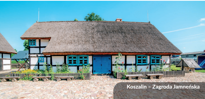
Koszalin – Zagroda Jamneiska