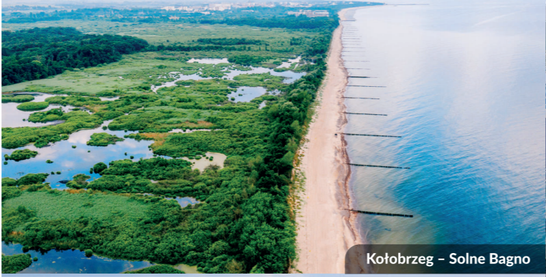
Kołobrzeg – Solne Bagno

Budowę tras rowerowych dofinansowano z Funduszy Europejskich