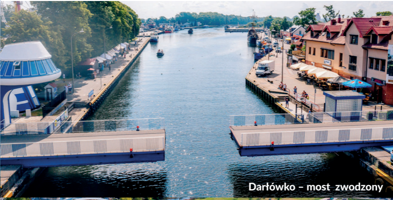
Darłówko – most zwodzony