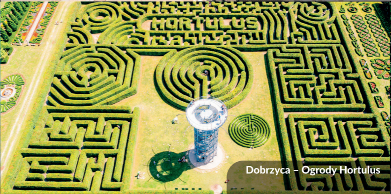
Dobrzyca – Ogrody Hortulus