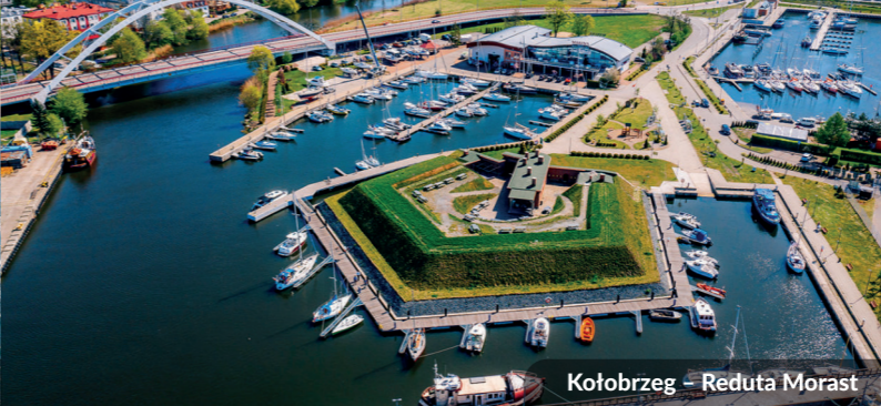
Kołobrzeg – Reduta Morast