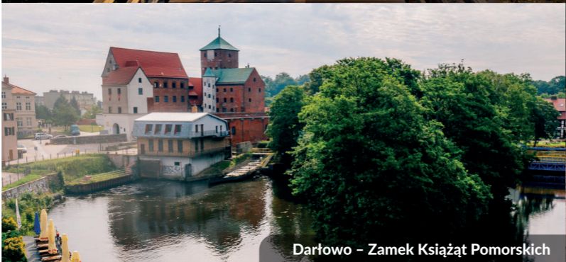
Darłowo – Zamek Książąt Pomorskich