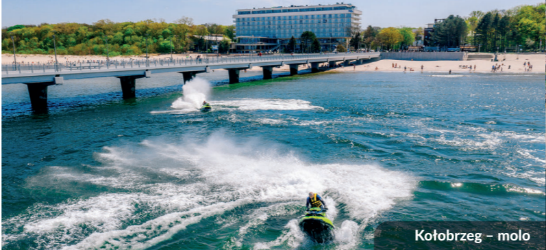
Kołobrzeg – moło