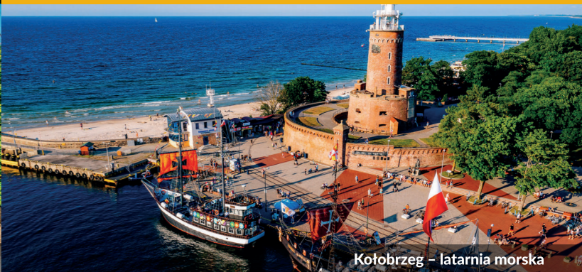
Kołobrzeg – latarnia morską