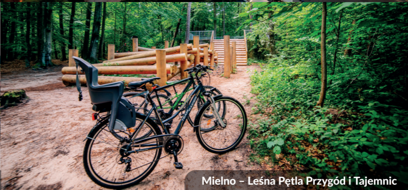
Mielno – Leśna Pętla Przygód i Tajemnic