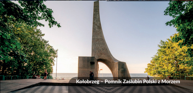
Kołobrzeg – Pomnik Zaślubin Polski z Morzem