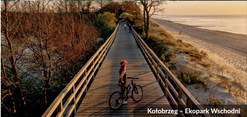
Kołobrzeg – Ekopark Wschodni