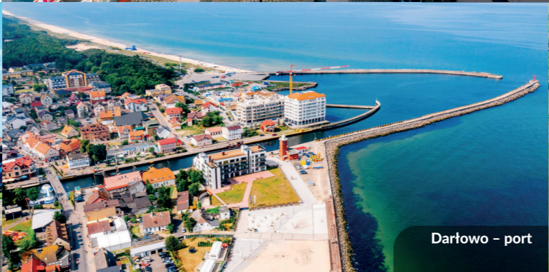
Darłowo – port