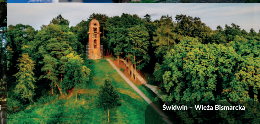
Świdwin – Wieża Bismarcka