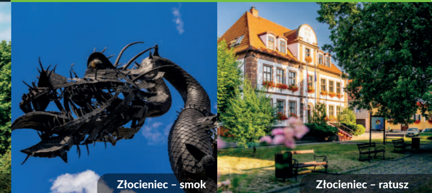
Złocieniec – smok