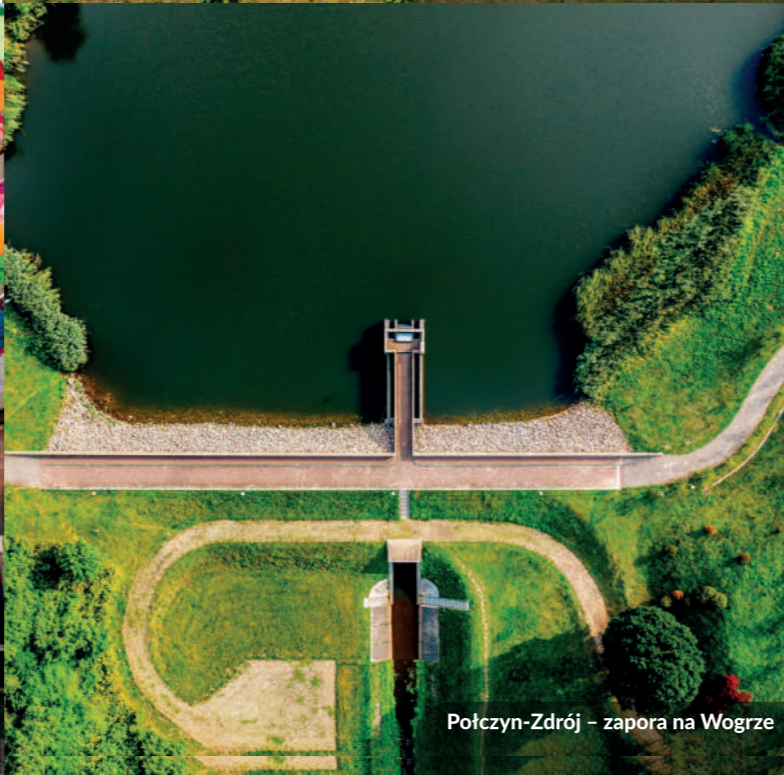
Połczyn-Zdrój – zapora na Wogrz