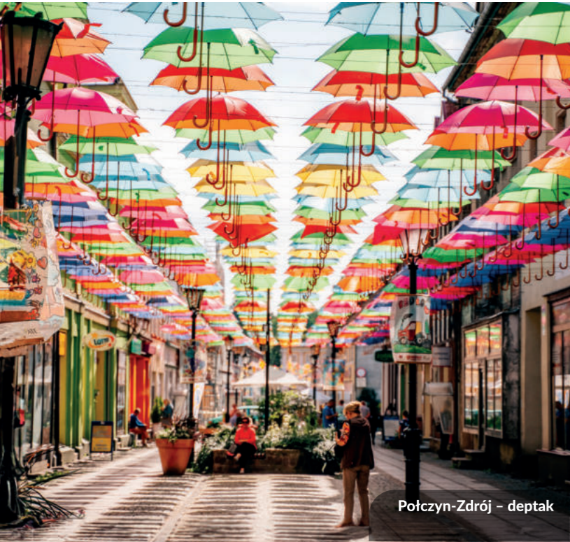
Połczyn-Zdrój – deptak