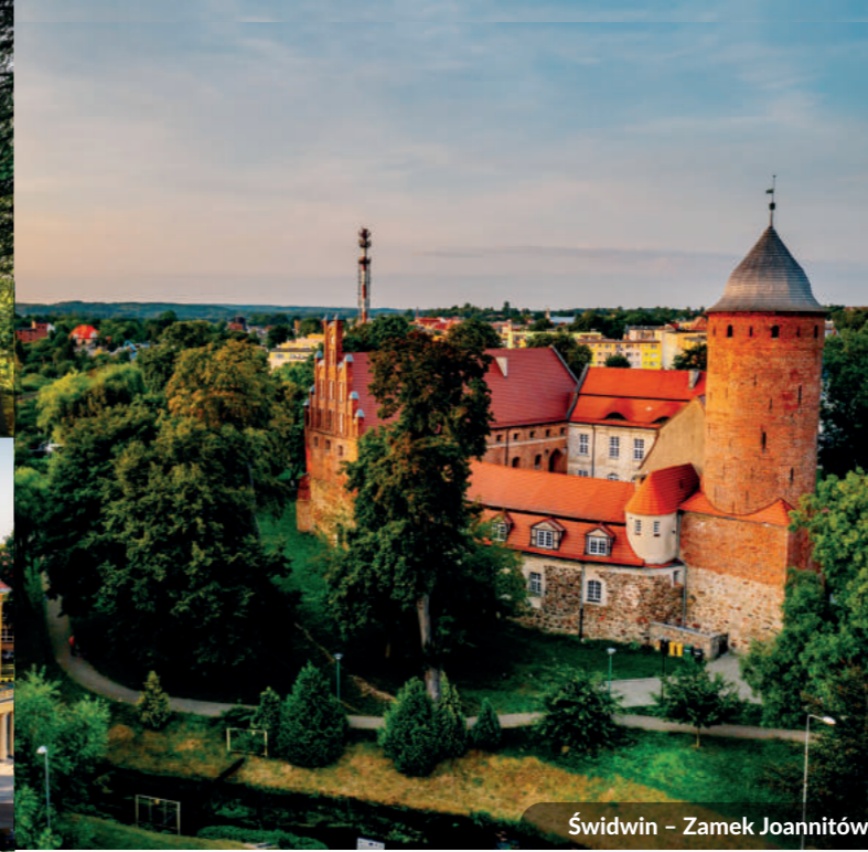
Świdwin – Zamek Joannitów