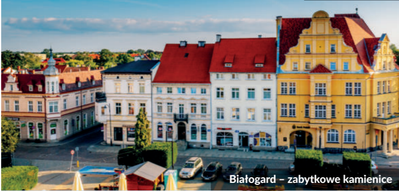
Białogard – zabytkowe kamienice