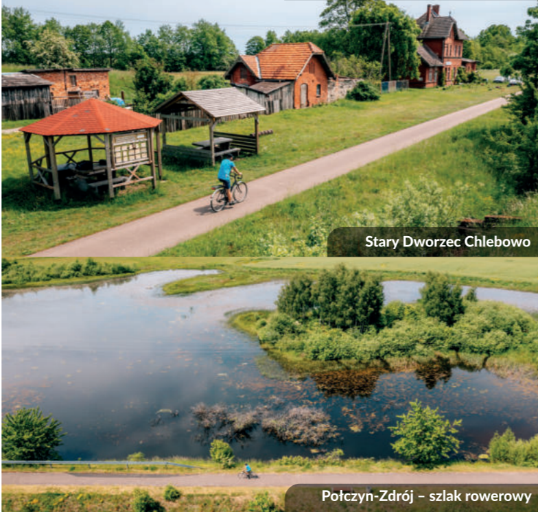
Połczyn-Zdrój – szlak rowerowy