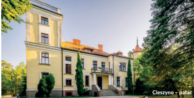
Cieszyń – pałac

Budowę tras rowerowych dofinansowano z Funduszy Europejskich