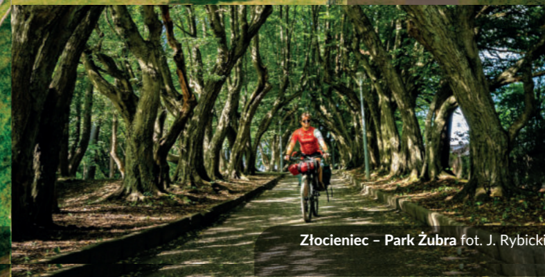
Złocieniec – Park Żubra