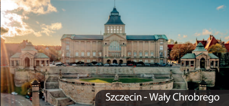
Szczecin - Wały Chrobrego