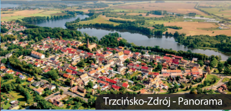
Trzcianko-Zdrój - Panorama