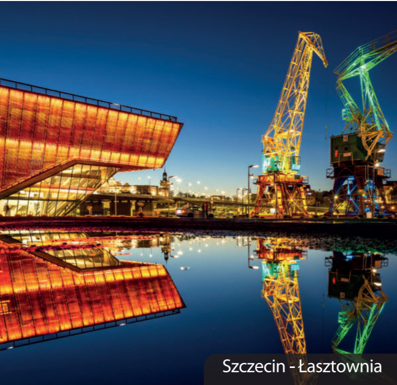
Szczecin - Łasztownia

Budowę tras rowerowych dofinansowano z Funduszy Europejskich