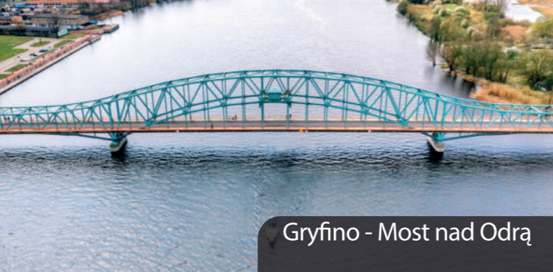
Gryfino - Most nad Odrą