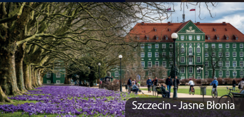
Szczecin - Jasne Błonia