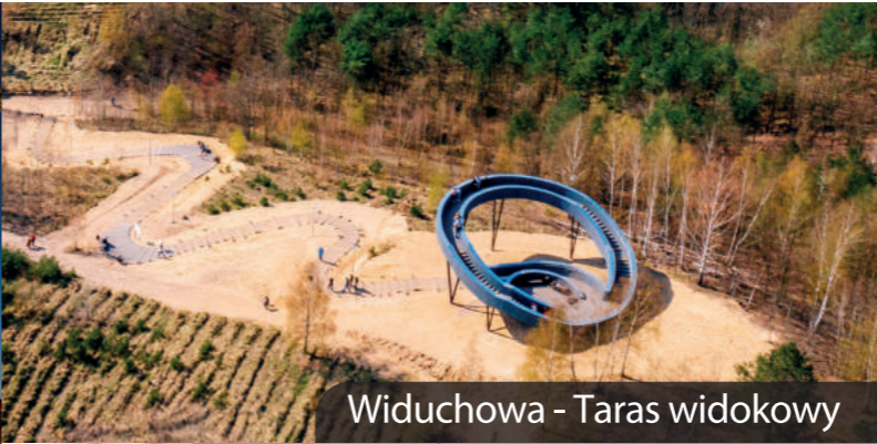
Widuchowa - Taras widokowy