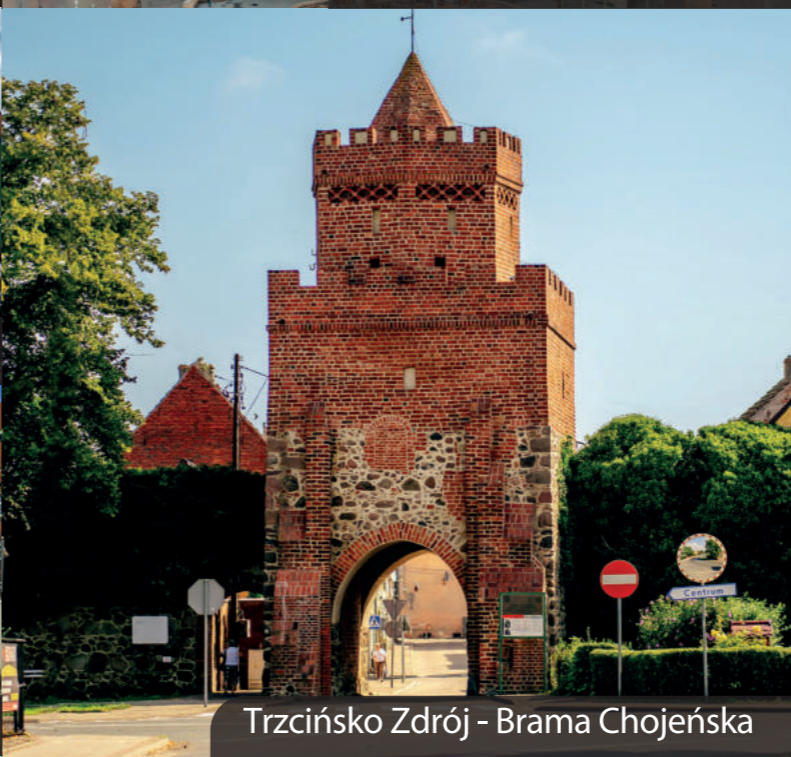
Trzcianko Zdrój - Brama Chojeńska