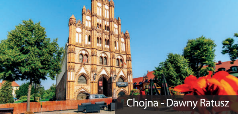
Chojna - Dawny Ratusz