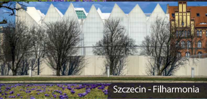
Szczecin - Filharmonia