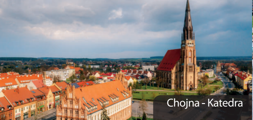
Chojna - Katedra