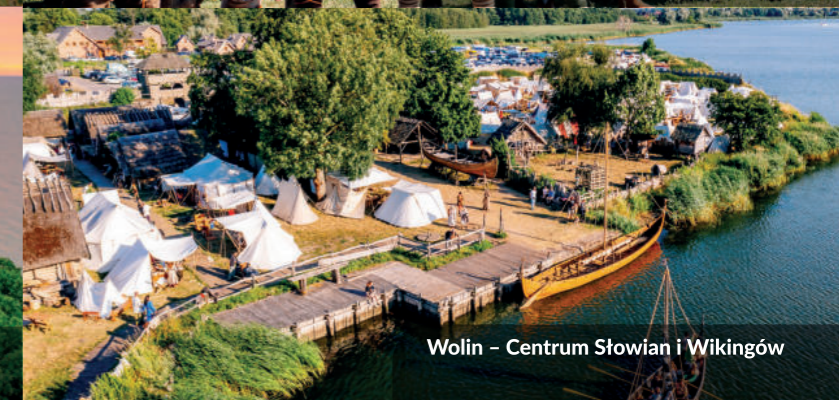
Wolin – Centrum Słowian i Wikingów