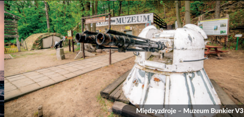
Międzyzdroje – Muzeum Bunkier V3