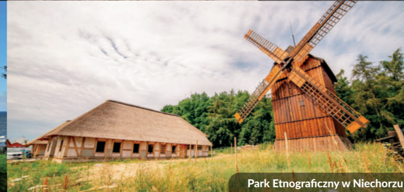
Park Etnograficzny w Niechorzu