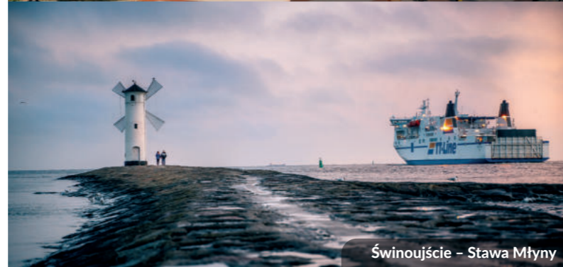
Świnoujście – Stawa Młynów