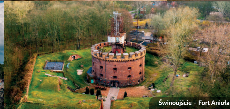
Świnoujście – Fort Anioła