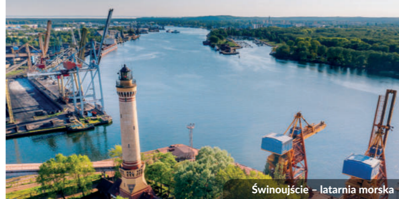
Świnoujście – latarnia morska

Budowę tras rowerowych dofinansowano z Funduszy Europejskich