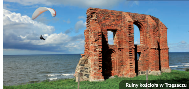
Ruiny kościoła w Trzemeszno