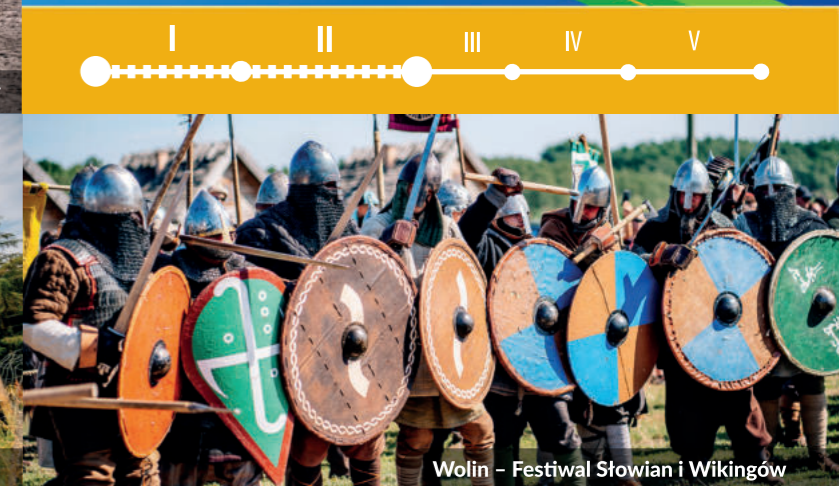
Wolin – Festiwal Słowian i Wikingów