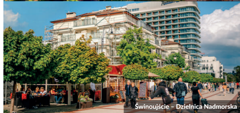
Świnoujście – Dzielnica Nadmorska