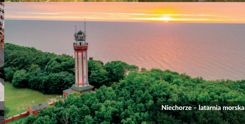
Niechorze – latarnia morska