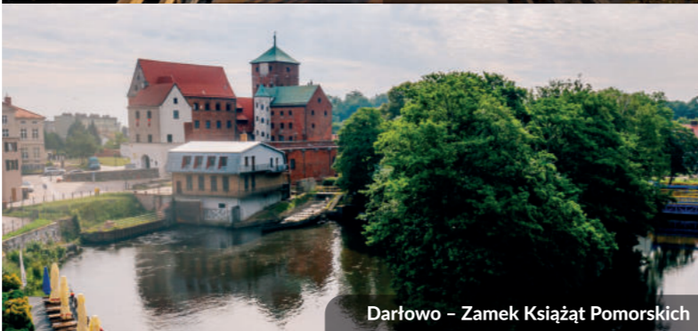
Darłowo – Zamek Książąt Pomorskich