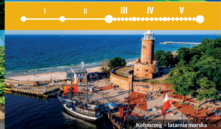
Kołobrzeg – latarnia morską