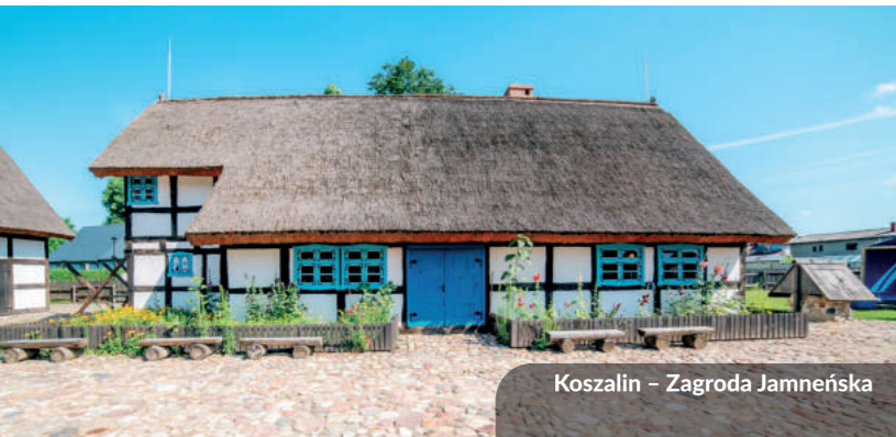
Koszalin – Zagroda Jamneńska