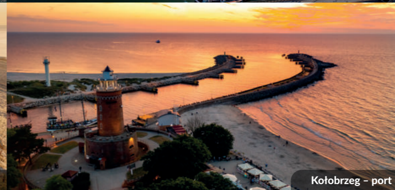
Kołobrzeg – port