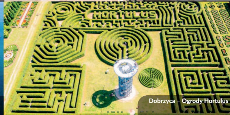
Dobrzyca – Ogrody Hortulus