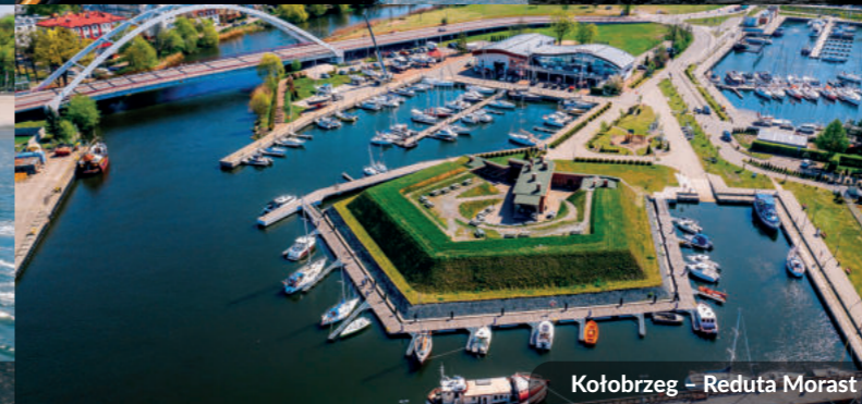
Kołobrzeg – Reduta Morast