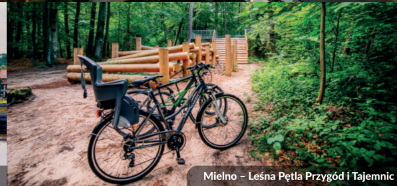
Mielno – Leśna Pętla Przygód i Tajemnic