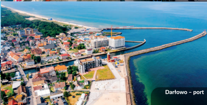
Darłowo – port