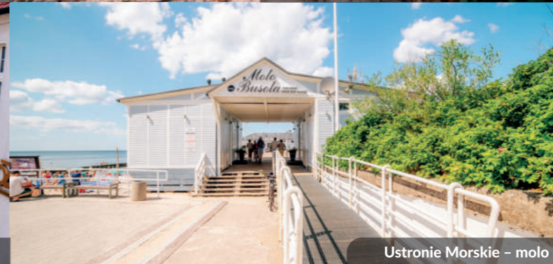
Ustronie Morskie – molo