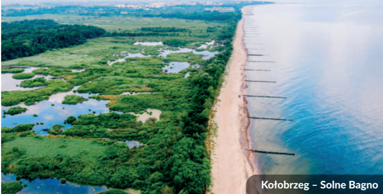
Kołobrzeg – Solne Bagno

Fundusze Europejskie dla Pomorza Zachodniego | Rzeczpospolita Polska | Dofinansowane przez Unię Europejską | Pomorzanie Zachodnie Budowę tras rowerowych dofinansowano z Funduszy Europejskich